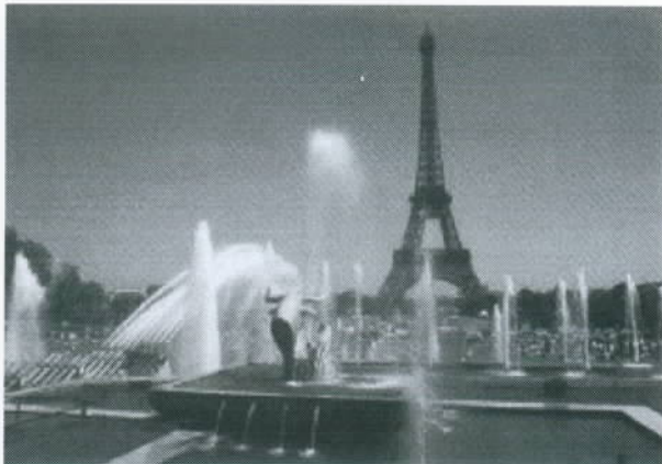
De Eiffeltoren in Parijs.

Let op! Bij deze opdracht wordt u beoordeeld op de spelling.