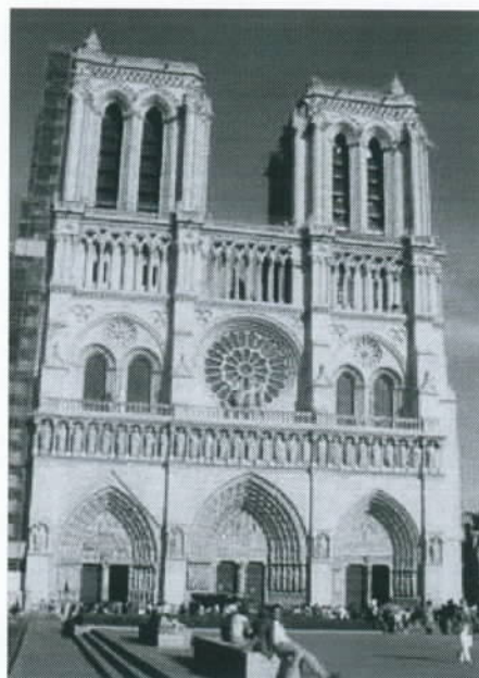
De Notre Dame in Parijs.